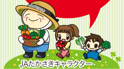
JAたかさきキャラクター 「高子さん、令ちゃん、和くん」