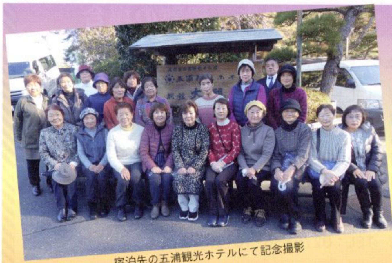
宿泊先の五浦観光ホテルにて記念撮影

※「准組合員からの意見・要望」は原文の趣旨を変えない範囲で変更している箇所があります。