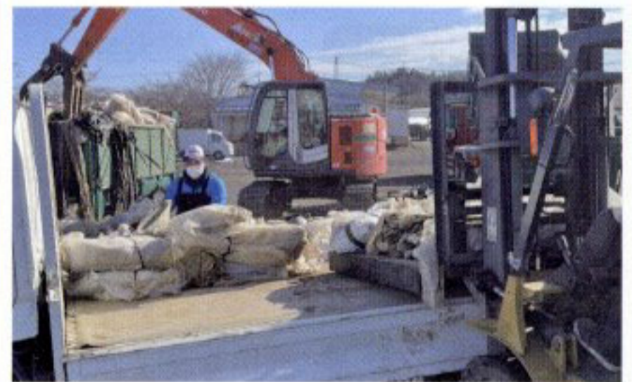
廃ビ・廃ポリ回収作業①

廃ポリは件数115件、処理重量約28t、廃ビニールは件数56件、処理重量約10tを県指定先の処理業者へ搬出しました。