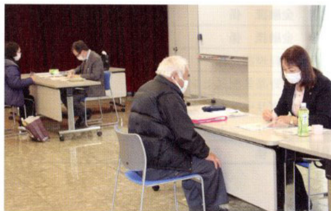
みどり地区の相談会の様子