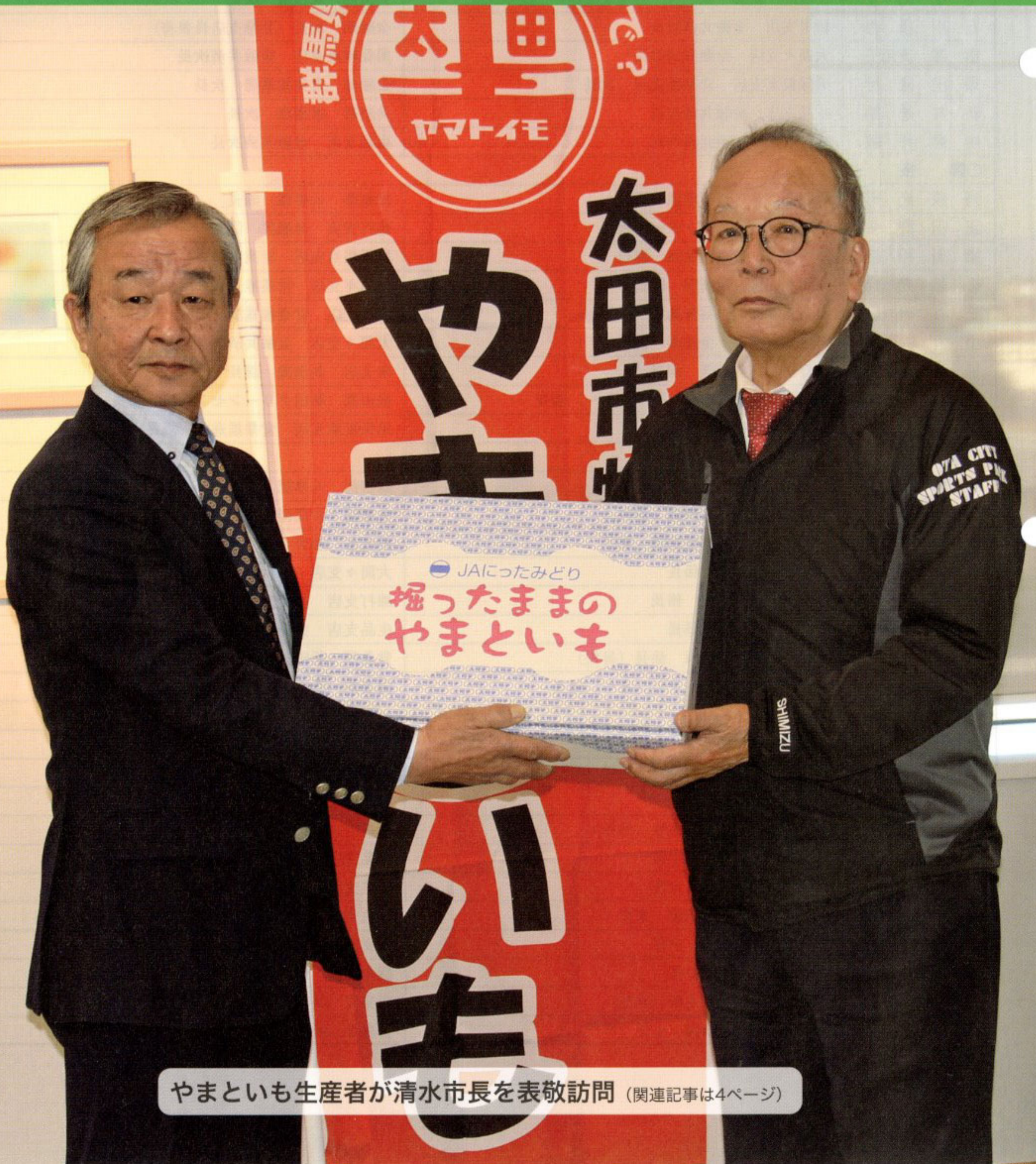
やまといも生産者が清水市長を表敬訪問 (関連記事は4ページ)