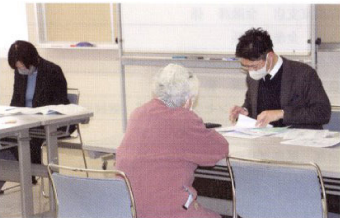
新田地区の相談会の様子

J A では、会員の負担に応えるため、毎年今の時期に開催していますが、今後も経営指導の一環として税務相談会等を開催し、会員への支援強化に努めてまいります。