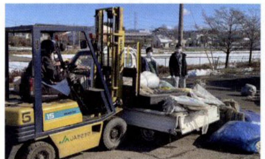
廃ビ・廃ポリ回収作業②