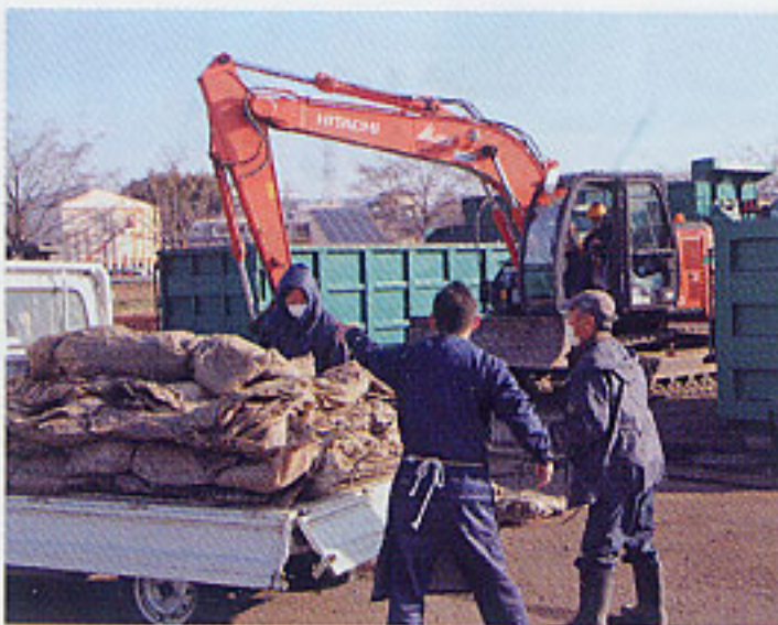
1月26日廃ビニール回収作業

県指定先である太田市の処理業者へ搬出しました。廃ポリは破碎加工後、石炭やコークスの代替燃料となる「RPF」に、廃ビニールは破碎加工後、セメントなどの原料として再利用されます。