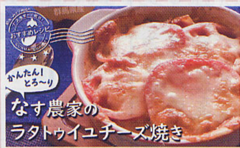
なす農家の ラタトゥイユチーズ焼き

※ラタトゥイユを作り置きして、パスタやピザ、ソース、付け合わせ等幅広く利用できる。ズッキーニ、ピーマン、カボチャ等を入れてもよい。 ※3はグラタン皿にのせ、オーブントースターで焼いてもよい。