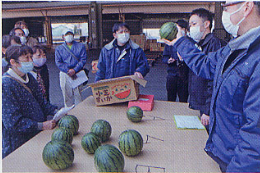
3/4小玉スイカ (笠懸野菜集出荷所)