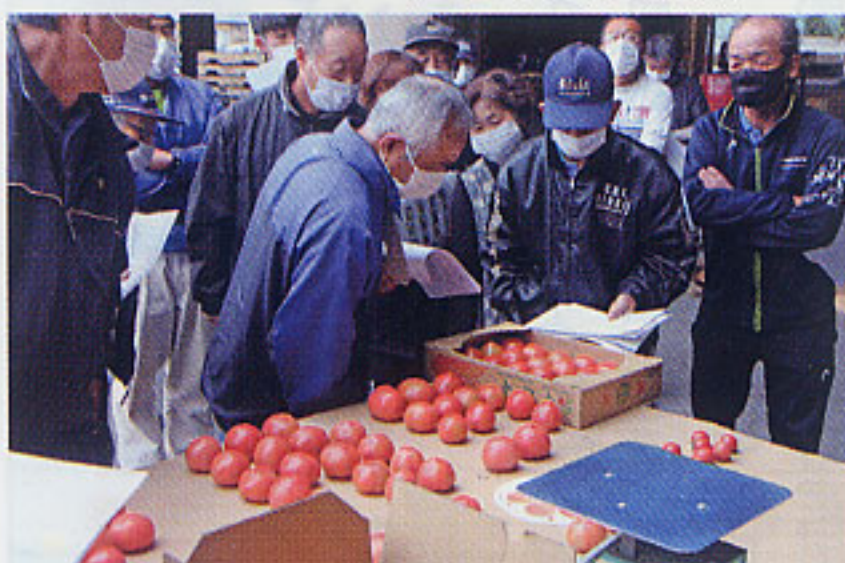
3/12大玉トマト (笠懸野菜集出荷所)