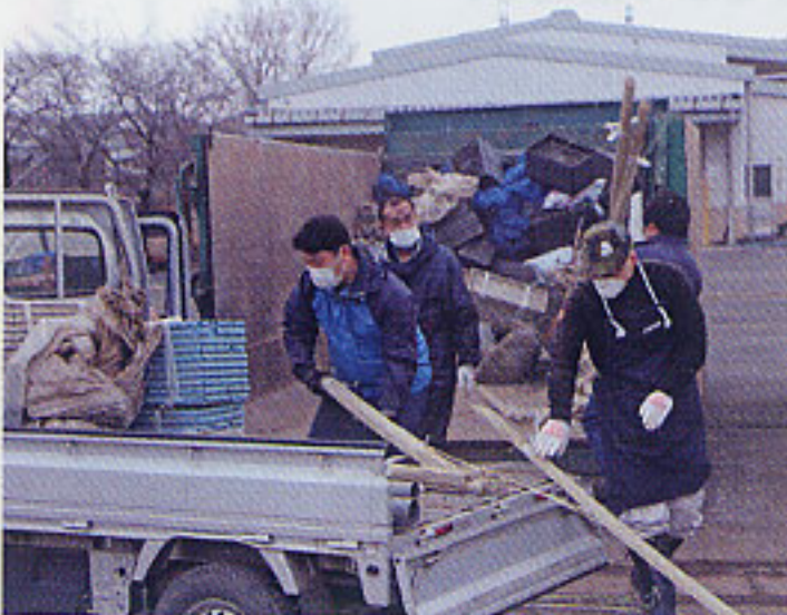
1月27日廃資材回収作業