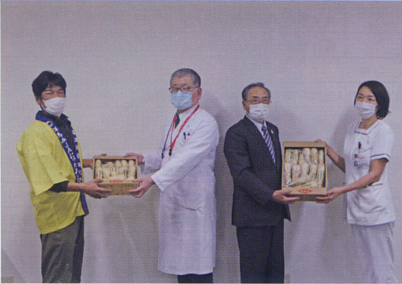
柿沼部会長（左）からヤマトイモを受け取る有野院長（左から2人目）ら