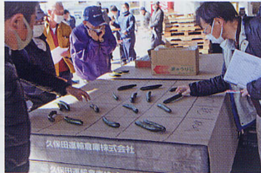
2/8キュウリ (新里野菜集出荷所)