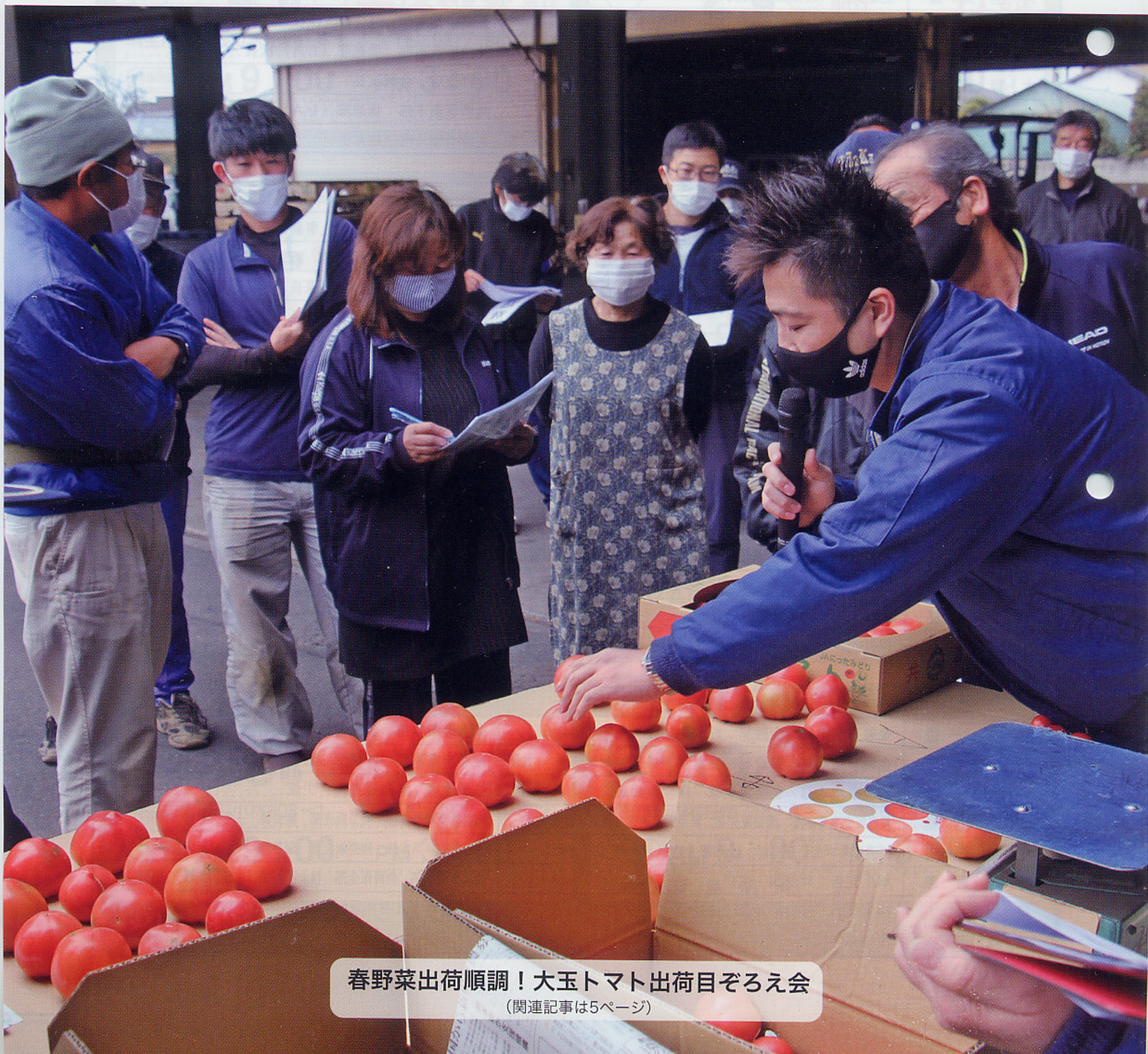
春野菜出荷順調！大玉トマト出荷目ぞろえ会 (関連記事は5ページ)