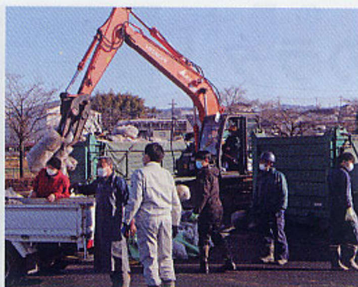
1月25日廃ポリ回収作業