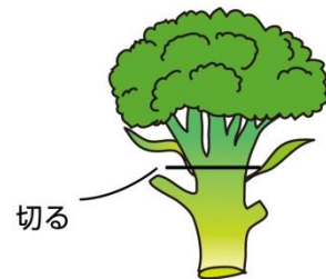
頂花蕾は茎を短めに収穫する

アブラナ科共通の問題ですが、コナガ、ヨトウムシなど各種の害虫にやられることが多いので、早期発見に努め、遅れずに捕殺、薬剤散布による防除を心掛けましょう。花蕾の中に食い込むと調理するときに厄介です。