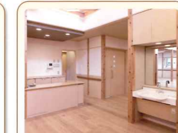
8 スタッフコーナー 何かあれば、すぐに対応 ナースコール完備