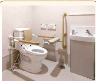
4 トイレ ゆったりとしたスペース 補助パー付きで安心