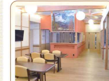
10 食堂・居間 体操やレク、談笑などの 楽しいひとときを