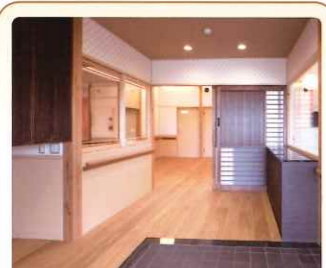
1 玄関 和を基調にした入口 段差のない玄関です

グループホーム(認知症対応型共同生活介護)とは、認知症の方が少人数(9人)を単位とした共同住居の中で、食事の支度や掃除、洗濯などをスタッフとともに行い、家庭的で落ち着いた雰囲気の中で生活を送ることにより、認知症状の進行を穏やかにし、家庭介護の負担軽減が図れるよう支援を行う介護サービスです。認知症グループホームのケアは、認知症の方が穏やかに、普通の生活を送ることができるようすることを何よりも優先します。認知症の方が「心身の痛みを緩和し」、「心を癒し」、「生活に満足できる」ように支援を行います。