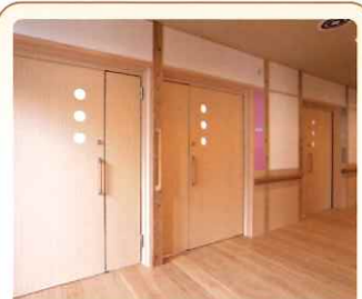
2 廊下 木の香りを感じられる ような廊下です