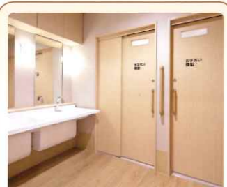
3 手洗い場 照明は感知センサー付き 夜でも安心機能です