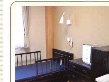
9 居室 洗面台・タンス完備