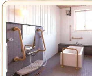
5 個浴・機械浴 両サイドから介助可能 機械浴もあります