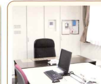
7 事務室 上陽の窓口です お気軽にご連絡を