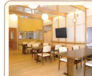
6 食堂 落ち着いた雰囲気食事が の時間を演出します