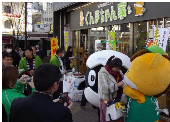
↑ 販う「ぐんまちゃん家」の前