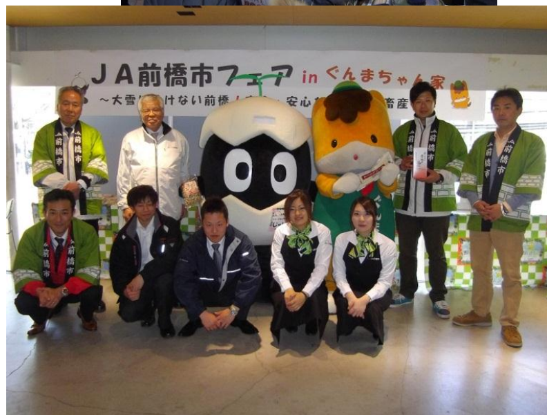
↑ 「ぐんまちゃん」「じゃじゃゴン」も関係職員と一緒に頑張ってPRしました！