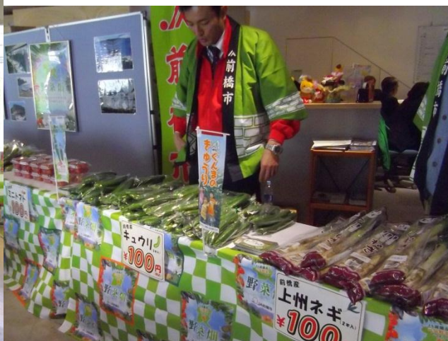
↑ 「キュウリ」「上州ネギ」などの管内自慢の新鮮野菜を即売