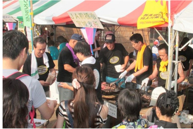
▲多くの来場者で賑わう宮城支所の模擬店