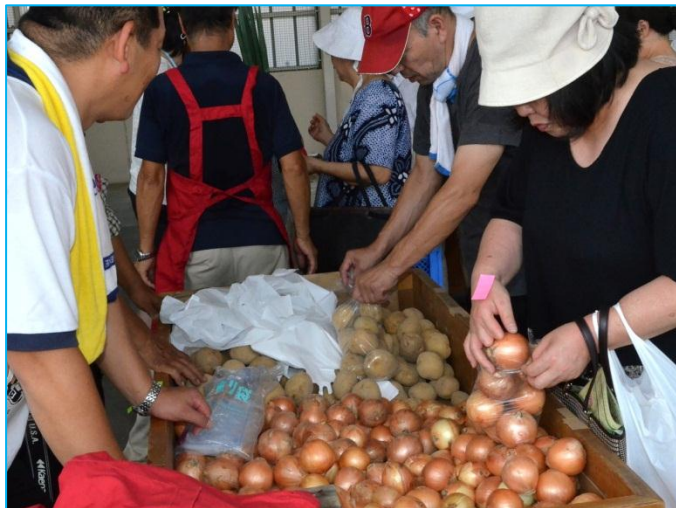
▲利用者にはたまねぎ・ジャガイモの詰め放題も