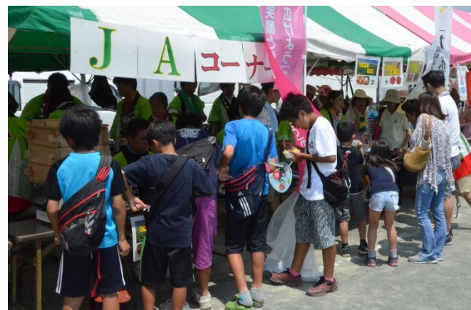
▲地元野菜を食材に使った模擬店は大好評