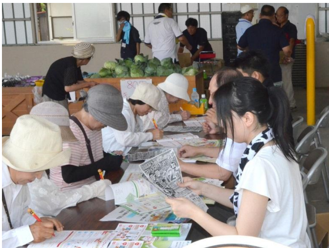
▲JAバンク、JA共済のキャンペーンを案内