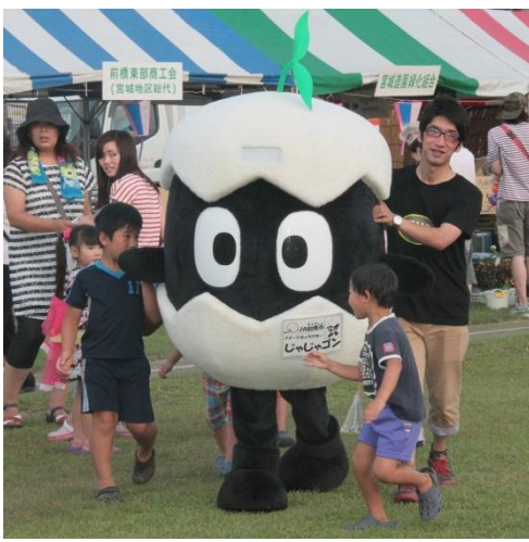
▲じゃじゃゴンが登場！

また、「みんなで踊るだんべえ」にも参加し、地域JAとしてイベントを盛り上げました。