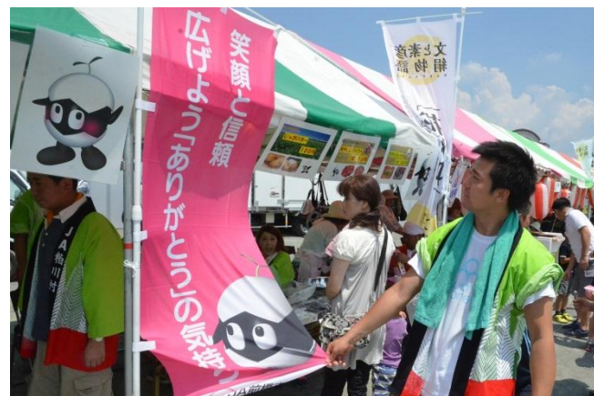
▲JA前橋市のキャッチコピーをPR