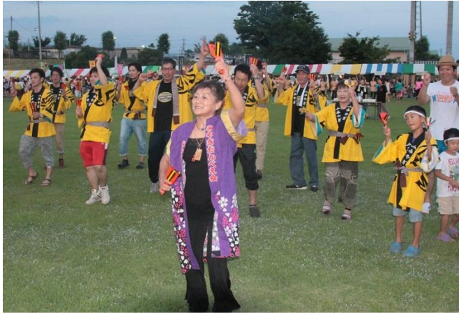
▲だんべえ踊りでも盛り上げました！