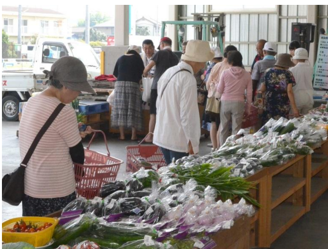
▲多くの新鮮野菜が並びました

南橋支所は、南橋支所産直部会と連携し、7月26日に支所の野菜集出荷場で「産直まつり」を開催し、当日は多くの来客者で賑やかとなりました。産直まつりでは、部会の生産者が丹精したキュウリ・トマト・枝豆など25品目ほどの新鮮野菜が並び、大特価にて販売されました。また、お楽しみ抽選会も実施され、イベントは大好評となりました。