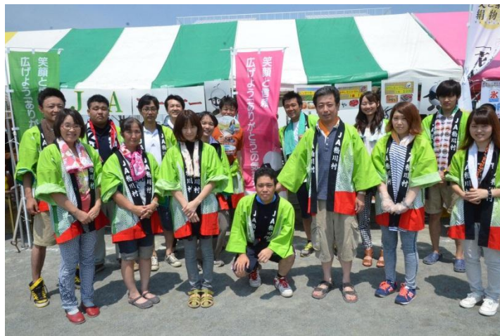
▲地域性をアピールした粕川支所のみなさん

粕川支所の関係職員が参加し、冷やしキュウリ、冷やしミニトマト、ジャガバターの模擬店を出店し、地元野菜ならびにJAの地域性をアピールしました。