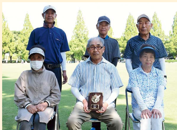
▲団体準優勝・上泉3・4区チーム（桂萱地区）