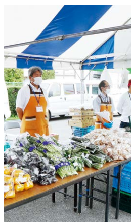
▶新鮮野菜を販売した産直ゆうあい館と産直部会

J A 前橋市は9月28日、亀里町のJ Aビル南側大駐車場で開催された収穫感謝祭2025に参加し、産直ゆうあい館やけやき工房、女性組織協議会が出店しました。