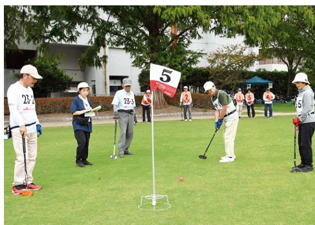
▶競技を楽しみながら親睦を深める選手 の皆さん

大会では、ストロークマッチにより勝敗を決定し、1チームの合計で団体賞、個人成績で個人賞をそれぞれ決めました。参加者は競技を通して交流を深めるなど、充実した大会となりました。