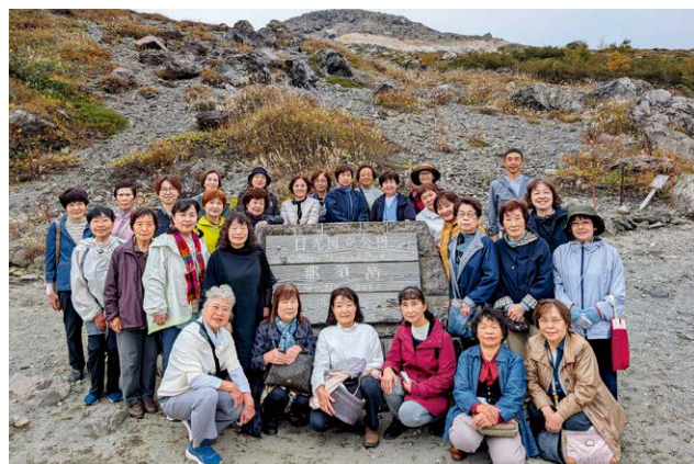
▲1号車（木瀬・荒砥・前橋・南橋・桂萱・総社・清里）

当日は、那須岳の峰の一つである茶臼岳山頂付近と山麓を結ぶ那須ロープウェイに搭乗。色鮮やかな紅葉と雄大な自然を満喫しました。その後、那須温泉神社の参拝や殺生石を見学。ホテルランチでひと休み後は、特産品のお土産選びで楽しいひと時を過ごし、日々の疲れを癒しました。より一層団結力を高めた協議会員