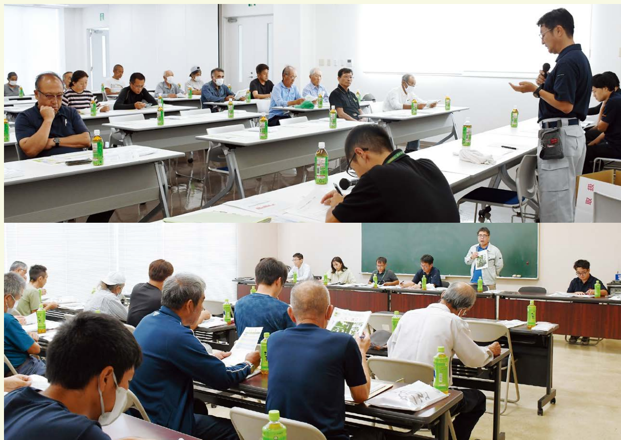
▲キュウリ栽培に向けて、各品種への理解を深める参加者

J A前橋市は、キュウリを野菜重点8品目の1つとして生産振興に力を入れており、農業者の所得増大・生産拡大に向け、今後も情報共有や栽培講習会などを通じて、生産者の支援をまいります。