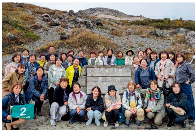
▲2号車（上川淵・南部）