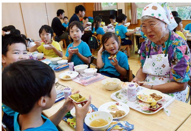
▶大学芋は園児たちにも大好評！

収穫を終えた園児と青年部員、同女性組織協議会員はいずみ幼稚園で一緒に昼食をとり、活動を振り返りながら交流を深めました。手作りの大学芋に、園児は「あまくておいしい」と笑顔を浮かべ、夢中で食べていました。