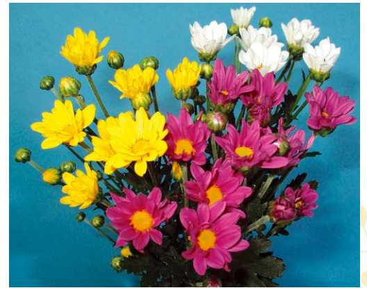
写真1) 県育成コギク品種