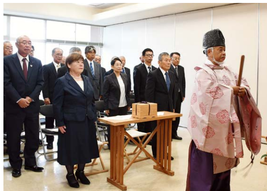
▲厳かな雰囲気の中、修祓式が執り行われました

修祓式は、同実行委員会関係者などが出席するなか、諏訪神社の石原宮司による玉串奉奠、献穀粟の献穀者授与などが行われました。