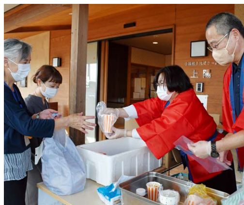
▲来場者へ農産物などの記念品をプレゼント

来場者には、ポップコーンや地元生産者が栽培した新鮮な野菜や米、牛乳などの記念品を配布しました。