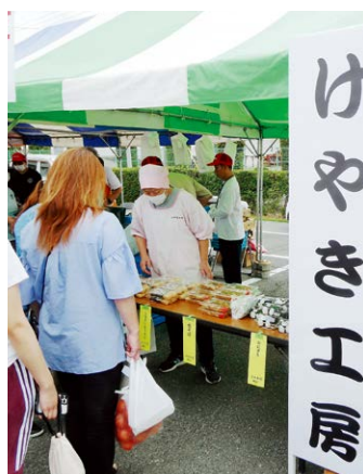
▶お弁当やお惣菜を販売したけやき工房

J Aグループ群馬が開催した当イベントは、豊かな実りへの感謝と安全で新鮮な県産農畜産物の提供、消費拡大をはかることを目的として開催され、当日は朝から多くの来場者で賑わいました。