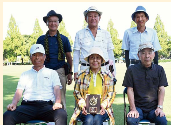
▲団体3位・日輪寺チーム（南橘地区）