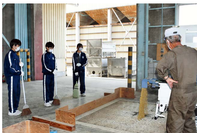
▲荷受けを手伝う生徒たち

また、生徒たちは農産物検査員の資格を持つ職員の指導のもと、米の等級格付けを行う品位検査を体験。皿に移した玄米の中から被害粒や未熟粒などをピンセットで取り除き、混入の程度を確認する作業を行い、品質管理の方法について学びました。その他、荷受けに來た生産者の手伝いをしながら交流を図りました。