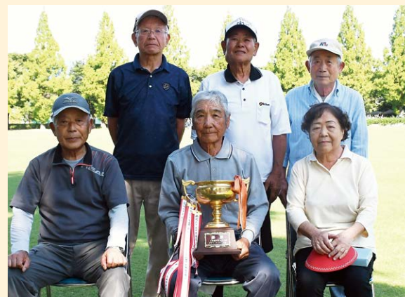
▲団体優勝・女淵Aチーム（粕川地区）