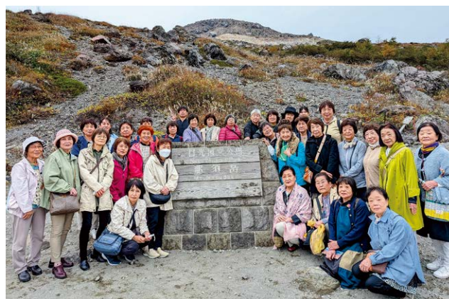
▲3号車（芳賀・東・富士見・宮城・粕川）