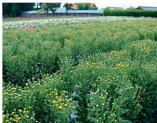
写真2) 収穫直前のコギク

(5) コギクだけで経営を成り立たせることは難しく、他の切り花や野菜などの品目と組み合わせることが必要です。コギクは出荷期が作業期のピークとなるため、ハウレンソウやタマネギ、ブロッコリーなど秋冬期に出荷する品目が有利です。