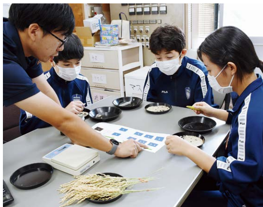
▲米の品位検査を体験しました

体験学習では、農業に関心を持つ生徒6人が南部ライスセンターと上川刈ライスセンターを訪問。普段目にするこのできない施設内の機械や職員の作業姿を見学し、J A職員