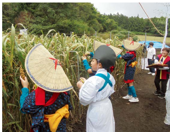
▲丁寧に粟を刈り取る地域の子どもたち

拔穂（刈取り）では、音楽に合わせて早男衣装・早乙女衣装の地元小学生や関係者が剪定鋏を使って粟の房を収穫し、盆に供えました。