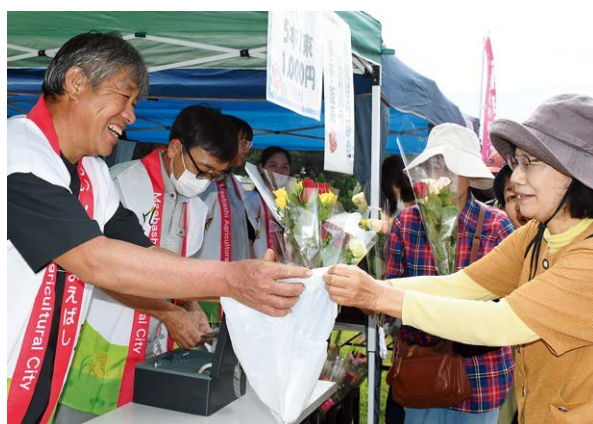
▲切りバラを販売する前橋ばら部会の摩庭部会長㊟

前橋市と前橋ばら部会は10月18日、敷島公園門倉テクノばら園で、「秋のバラフェスタ2025」の開催に合わせ、前橋産切りバラの展示販売を行いました。バラの産地「まえばし」のPRと同部会生産者が栽培する高品質かつ多品種のバラを広く周知することを目的としました。